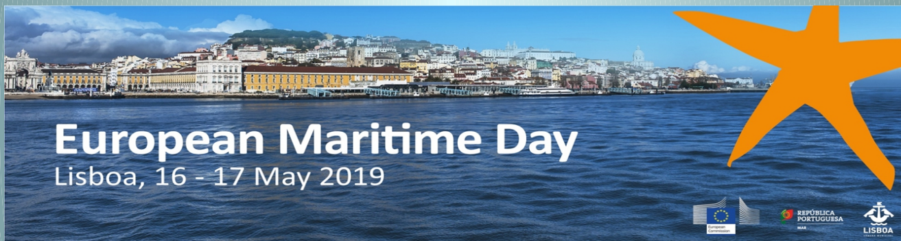
Photo Contest for the European Maritime Day

Per uno sviluppo sostenibile – Perché il mare sia e continui ad essere immensa e straordinaria risorsa per tutti