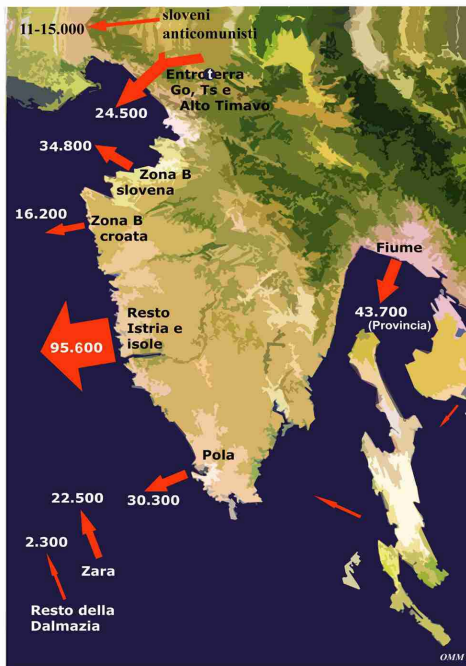
Luoghi di partenza